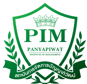
1-Color Green Gradient ใช้สีเฉพาะที่กำหนดให้เท่านั้น