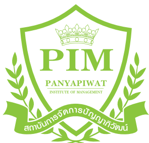
1-Color Green C50 M0 Y100 K0