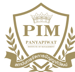
สีทอง Metallic : PANTONE 871 C C 20 M25 Y 60 K 25 สีทอง Hot Stamp : SL