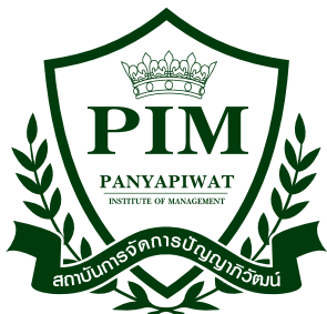
1-Color Green C100 M0 Y100 K80