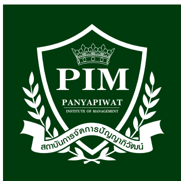
1-Color White C50 M0 Y100 K0