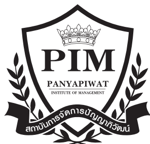
1-Color Black C0 M0 Y0 K100